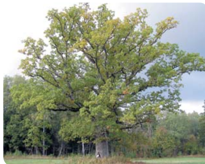
▲ Pauguru ozols Lāčūmsku priede ▼ Jauntulku ozols ►