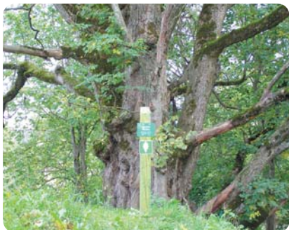
▲ Krasta viksna Rūķeru paeglis ▼