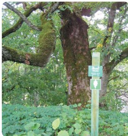
▲ Spārīšu viksna Rankas viksna ▼