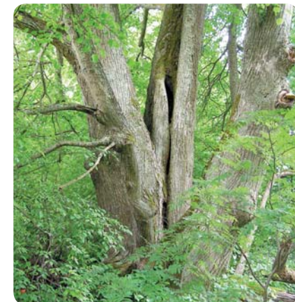
▲ Vecdupāņu liepa