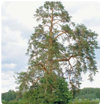
▲ Ziedoņu priede Viteru ozols ▼