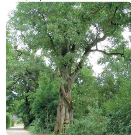
▼ Teiku vikсна